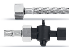
Wąż doprowadzający DN 8 3/8" - 3/8" z zaworem zamykającym