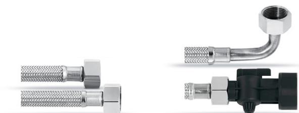
Zawór zamykający, 3/4" - 1"