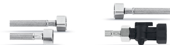
Zestaw węży I