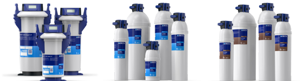
PURITY Quell ST

Poniżej znajduje się przegląd kompletnej gamy produktów filtracyjnych PURITY, zaprojektowanych specjalnie dla automatów sprzedających. BRITA Professional to odpowiednie rozwiązanie, zapewniające doskonałą wodę dla Twoich potrzeb – bez względu na jakość lokalnej wody.