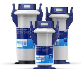
PURITY Quell ST